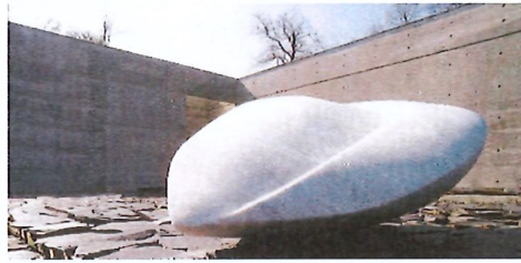
Présence de l'Esprit 1990 Marbre de Carrare Musée de l'ancienne abbaye Landevennec Finistère