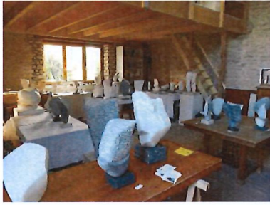
Exposition – Atelier Bazoches les Gallerandes