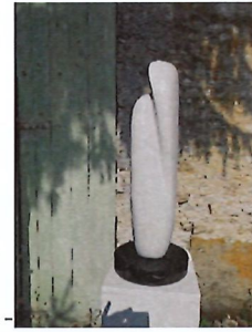
Fusion Marbre de Carrare