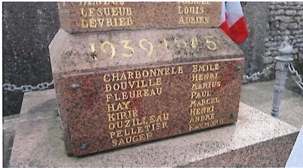
Monument aux Morts – Cimetière de Bazoches