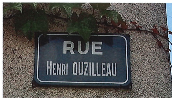
Une rue de Bazoches