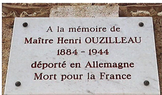
Sur les murs de l'ancienne étude de Bazoches

La mémoire de Henri OUZILLEAU est restée bien présente à Bazoches : plaque commémorative apposée sur son ancienne étude située dans la rue qui porte aujourd'hui son nom, inscription au Monument aux Morts du village. Son nom figure également sur le Monument des Déportés à Pithiviers ainsi que sur une plaque à Orléans.