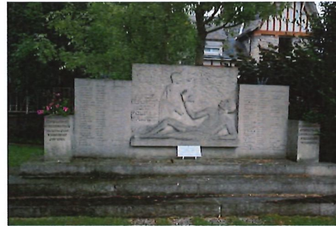
Monument des Déportés à Pithiviers