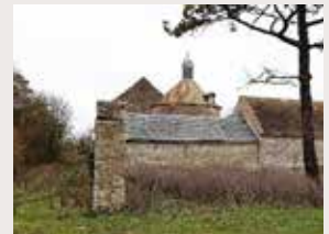
Ferme de Landreville