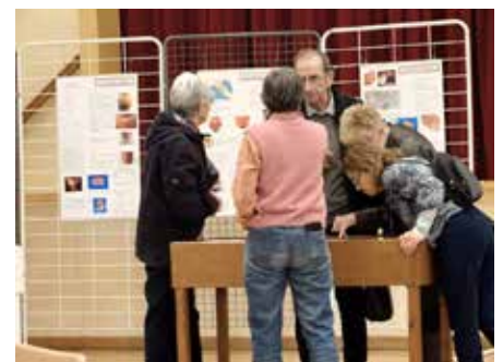
Exposition la Beauce à travers les âges

Que les personnes qui souhaitent nous rejoindre n'hésitent pas à le faire !... Elles seront les bienvenues. ■