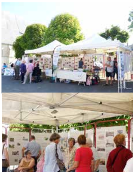
Stand de l'Association lors du vide-grenier

L'Association « Dans les Ouches » était présente en septembre lors du vide-grenier à Bazoches. Nombreux furent les visiteurs à venir évoquer des souvenirs de jeunesse devant les panneaux présentant « La Beauce sucrée », du temps où le petit train de betteraves sillonnait notre coin de Beauce.