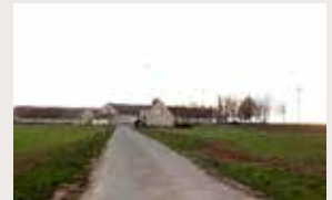
Sur la route de la Brière