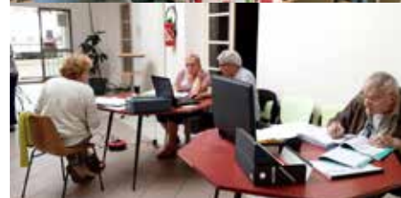
Permanence du Loiret Généalogique