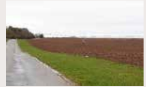
Près de Landreville