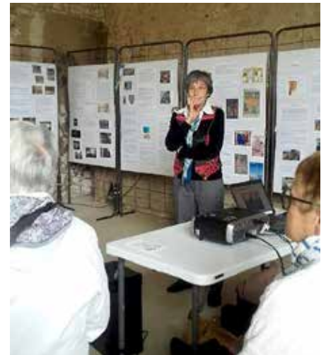
Ferme des petits bergers à Attraps

Ainsi, l'Association des Ouches fut présente et reconnue en maints endroits, toujours à titre bénévole. Merci aux Adhérents, à la municipalité de Bazoches ainsi qu'à la C.C.P.N.L. pour