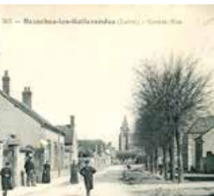
Étude de Bazoches