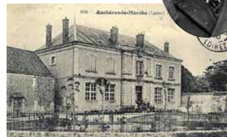
École d'Aschères 1910