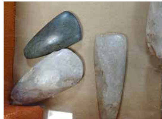
Haches polies du néolithique

leurs aides sans lesquelles nous ne pourrions pas développer nos actions. Chaque année des nouveaux projets sont à réaliser.